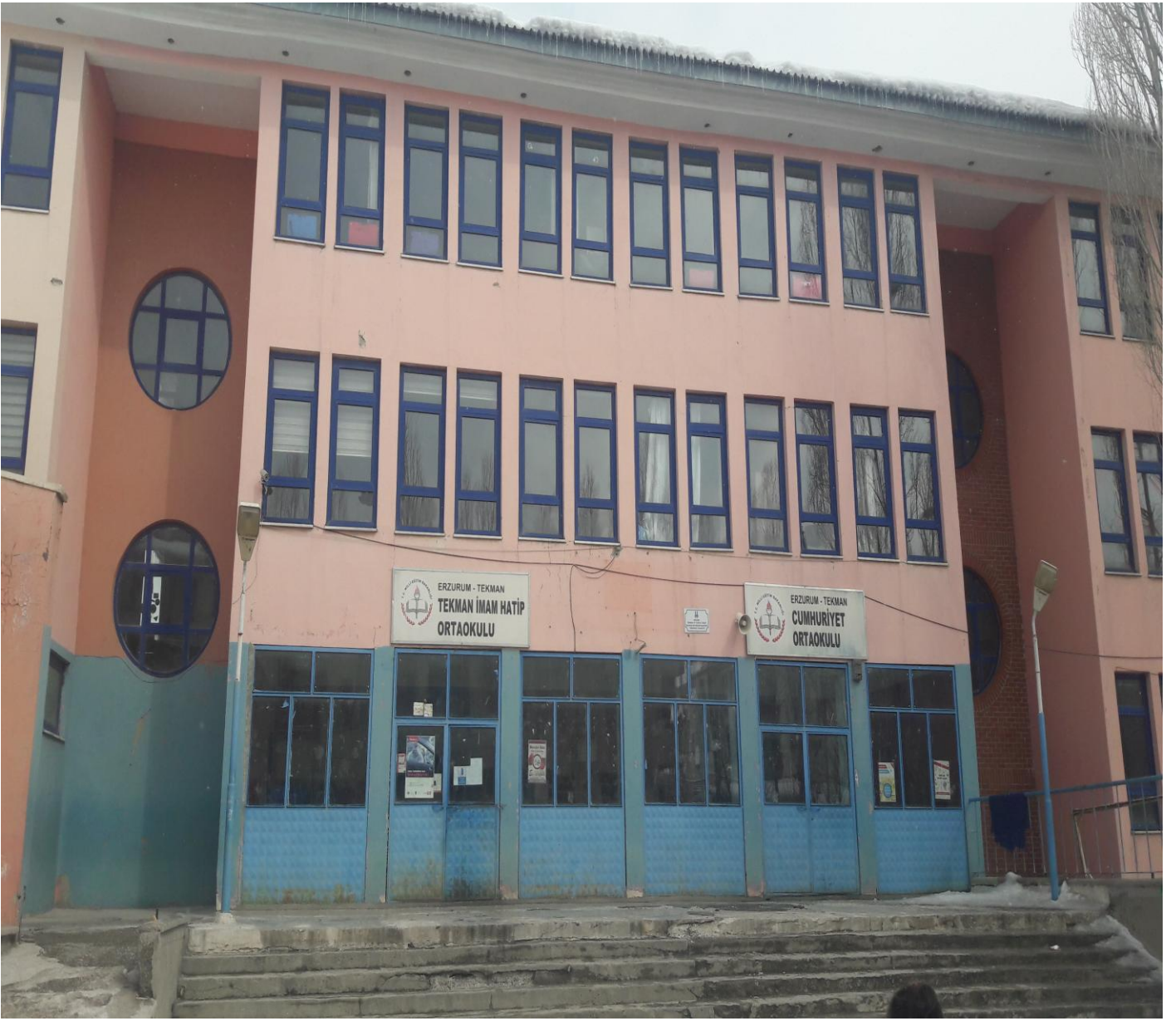
TEKMAN İMAM HATİP ORTAOKULU